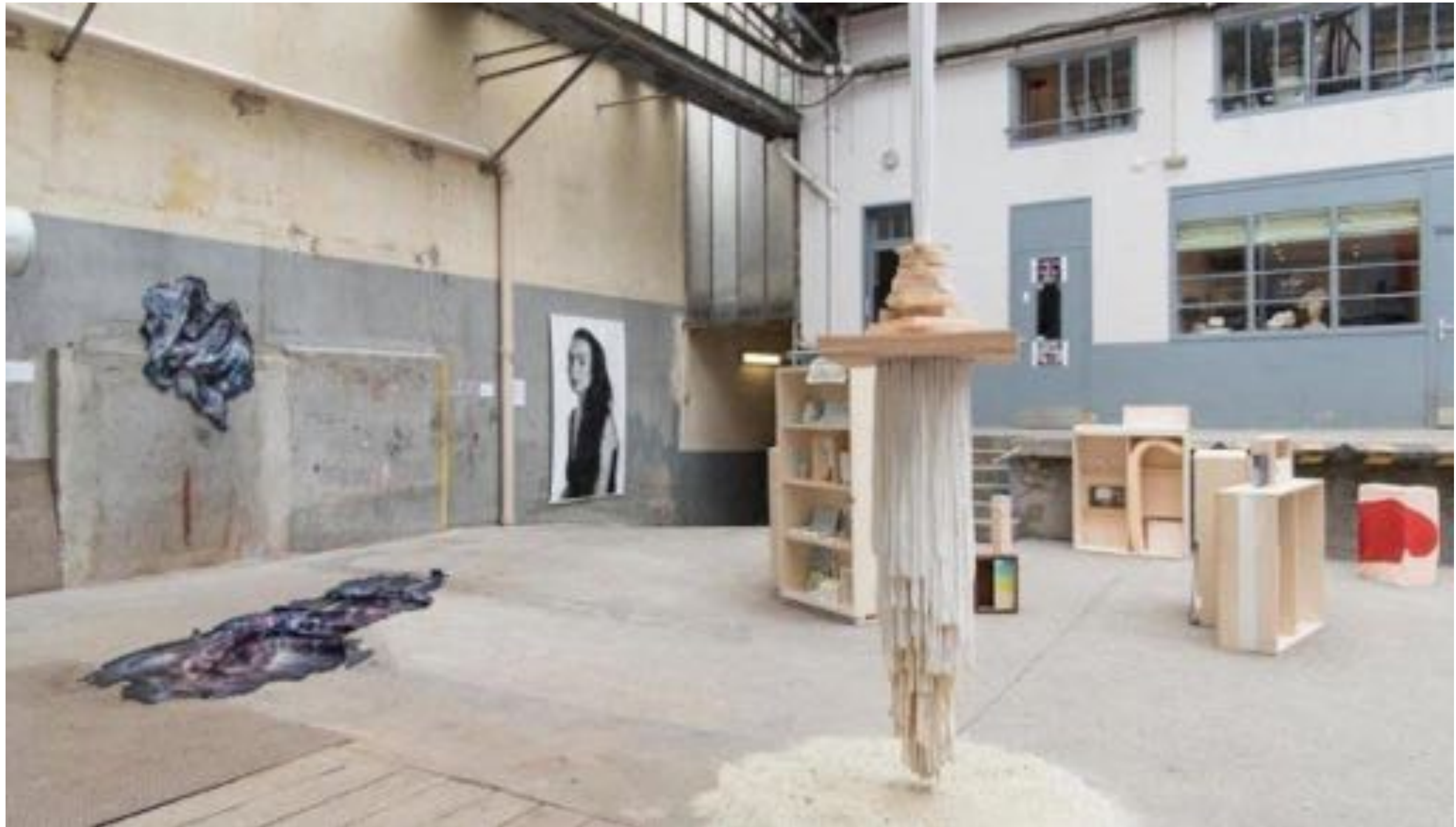
"ARTAGON.III", Paris, 2017, Exhibition view