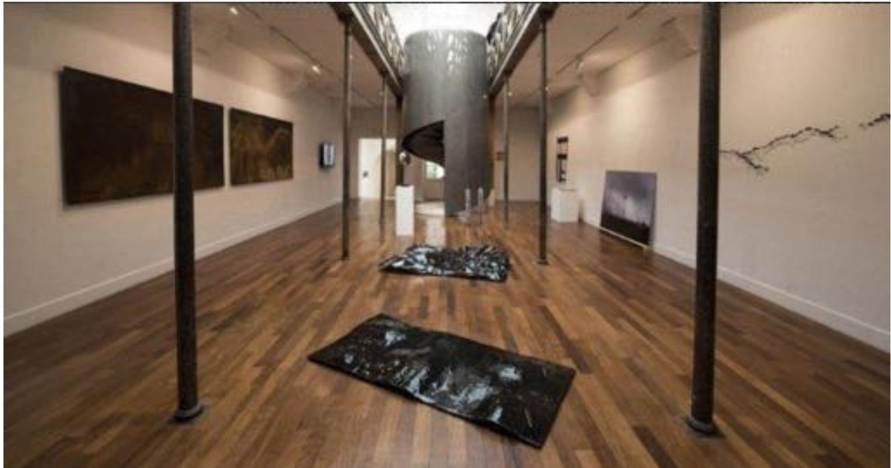
"ARTAGON.II", Paris, 2016, Exhibition view