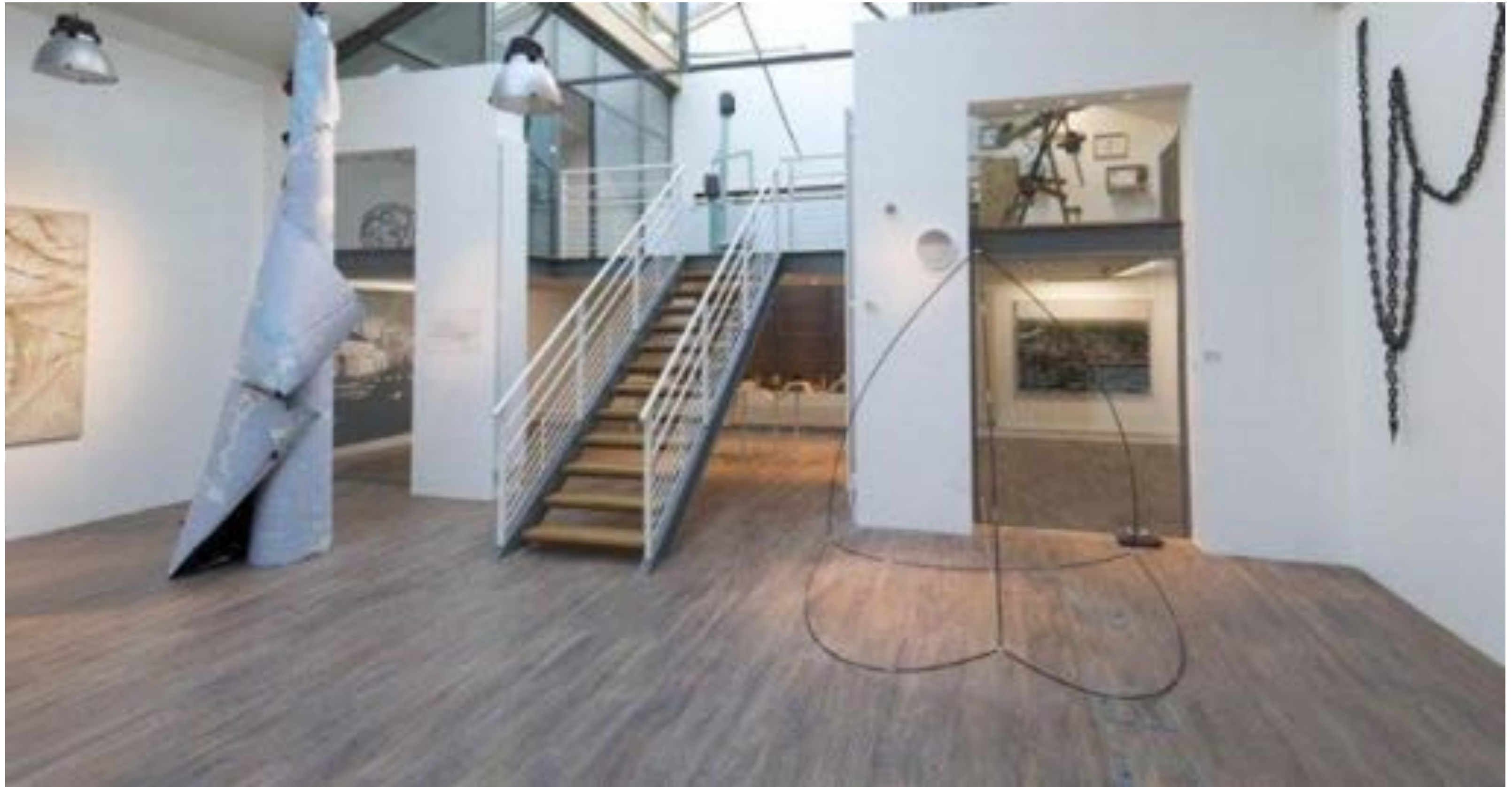
"ARTAGON.I", 2015, Exhibition view