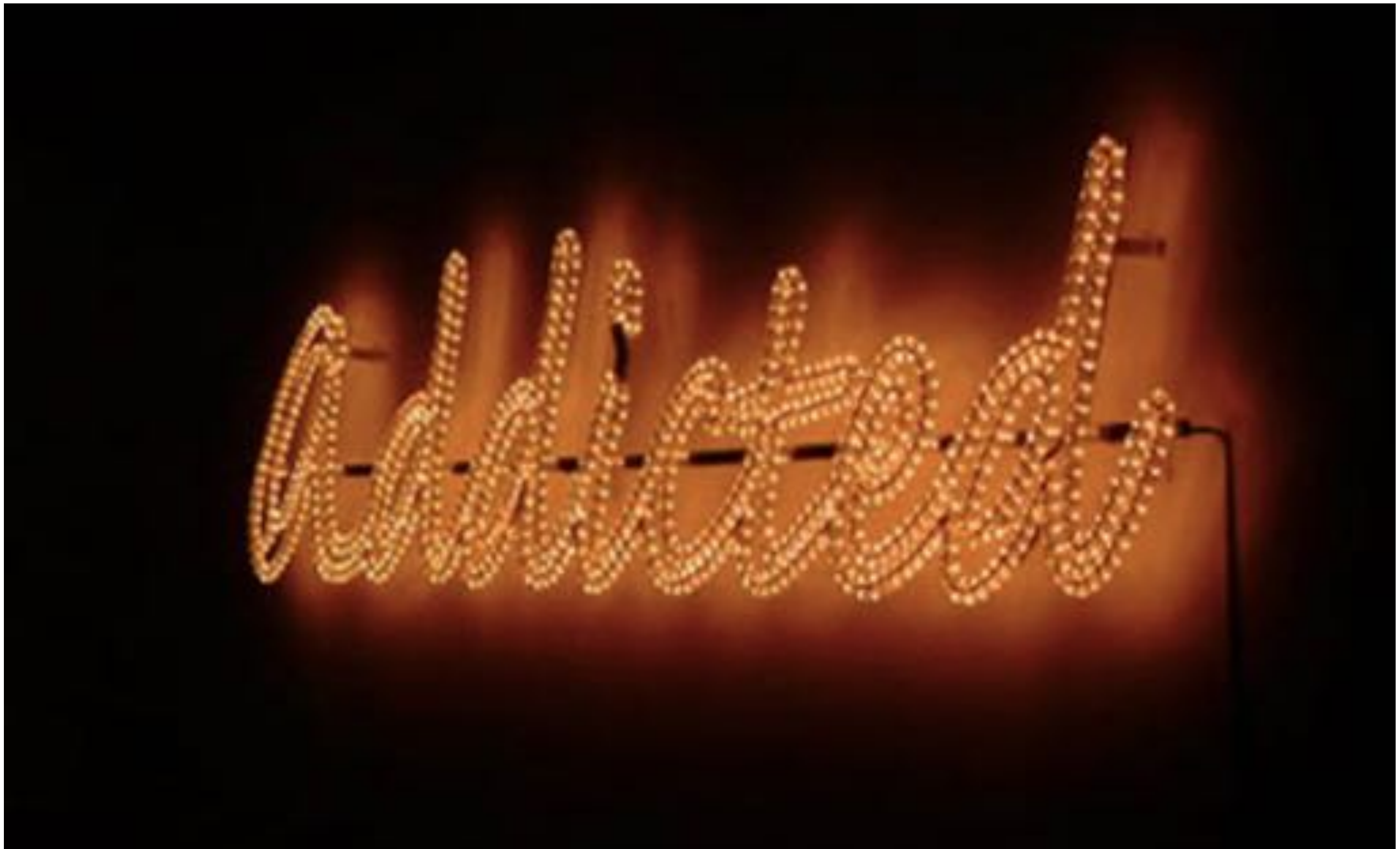
Addicted - 2003